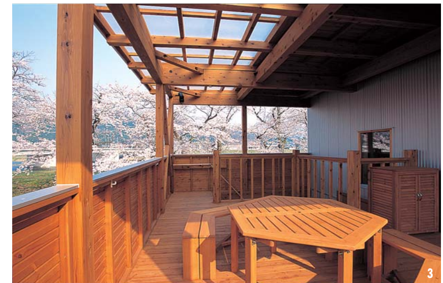
1.吹き抜けの玄関ホール。この床下にはワイドな地下室が設けられている。2.会話が弾む対面型のキッチン。IHクッキングヒーターの火力には奥様も大満足。3.多目的に利用できるカラマツのデッキ。サンルーフを利用した半戸外で、陽射しを享受。