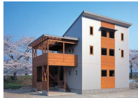
片流れの屋根とスパンサイディングのシンプル＆モダンな箱型デザインの外観が、桜木川内の満開の桜並木に映えて。

「家づくりの主役はそこに住む家族」をモットーに、納得のいくまで打ち合わせを重ね、快適・健康・安心を追求した高断熱・高気密住宅を提案。品質を保つため自社施工にこだわり、社員大工も勤務年数10〜25年のベテラン揃い。現代風デザインはもちろん、角館の町並みに溶け込む和風木造住宅も手がけるなど、地域密着型のビルダーです。