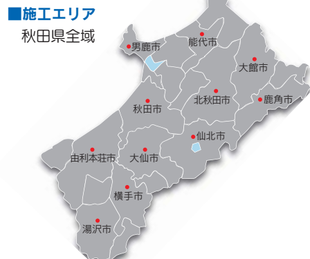
■施工エリア 秋田県全域

の経験から推奨しているのが、高性能断熱材「アキレスボード」による外張り断熱工法。従来のパネル工法ではできなかった大空間の実現に加え、小屋裏も活用でき、吹き抜けや居住スペースにも使えるロフトなど自由な間取りが可能です。 今年5月には、暖房を従来の蓄熱式から温水パネルヒーターに変えた、新しいタイプのオール電化住宅が完成。しかも断熱性能は、ここ大仙・仙北地域の次世代省エネルギー基準Q値1.9を遥かに上回る1.06を実現しています。 「省エネ、快適さ、健康的、そして耐久性。全ての条件を追求したのがこの住まい。これを一つの例として、お客様にはコストバランスも考えて提案していきたいですね。設計と現場の意思疎通がダイレクトにできる当社は、どんなご要望にも忠実にお応えできる自信があります。」