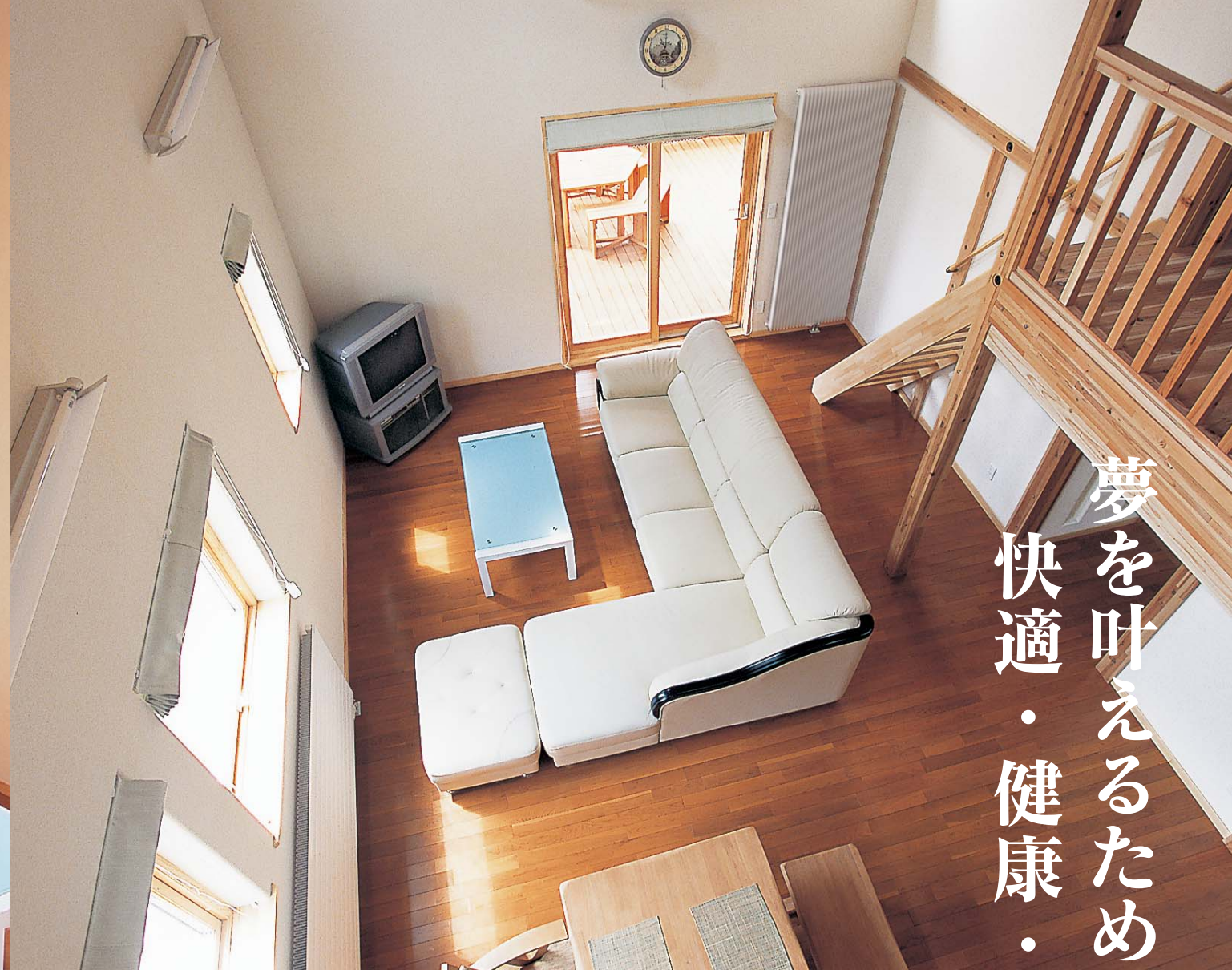
約6mの高さの吹き抜けから見渡すLDK。これだけの大空間の温度調節ができるのは断熱性能Q値1.06 W/m 2 K ならでは。