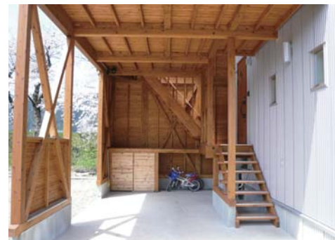
ガレージと玄関入口の階段。自転車や収納スペース、エコキュートの室外機設置も考慮。

綿密な打ち合わせによるプランニングと設計から、大工工事も下請けを使わず、全て自社で施工。品質を保つため年間12〜14棟程度に限定した着工棟数と、創業時から手がけた全住宅・年2回の訪問を徹底させたアフターサービス。その実直で真摯な家づくりの姿勢は、まさに「職人集団」。それが、仲野谷工務所です。