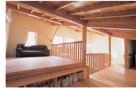
秋田県仙北市・Nさん宅

Nさん邸を仲野谷工務所の「次世代型提案住宅」と位置づけ、温水パネルヒーターを使った超高断熱仕様のオール電化住宅に。