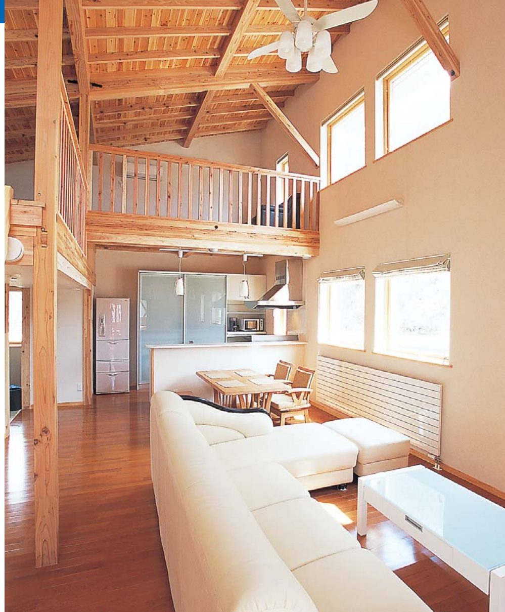
2階部分には、LDKのほか子どもたちの勉強部屋になる可動式カウンター付きのシンプルな和室もある。

1969年仙北市生まれ。法政大学工学部建築学科を卒業後、県内の総合建設業勤務を経て故郷角館へ。社長である父と共に、これまで新築住宅、改築リフォームで130棟を手がけ、設計施工ともに一棟専心の気持ちで品質の高い家づくりを目指す。スキーはSAJ1級、柔道三段の腕前で、地元柔道スポーツ少年団のコーチも務める熱血派。家では双子の息子の良き父親で、仕事の合間に子供達と遊ぶのを何よりの楽しみにしている。人との出会いを楽しみ、大切にする専務の座右の銘は「一期一会」。